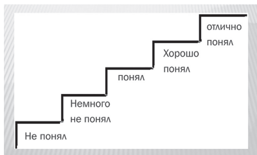
Рис. 3. Лестница достижений

— Какая профессия у взрослого? Что ему нужно делать на рабочем месте?