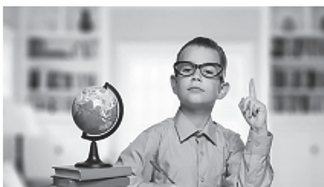
Рис. 9. План формирования умения осуществлять мониторинг деятельности