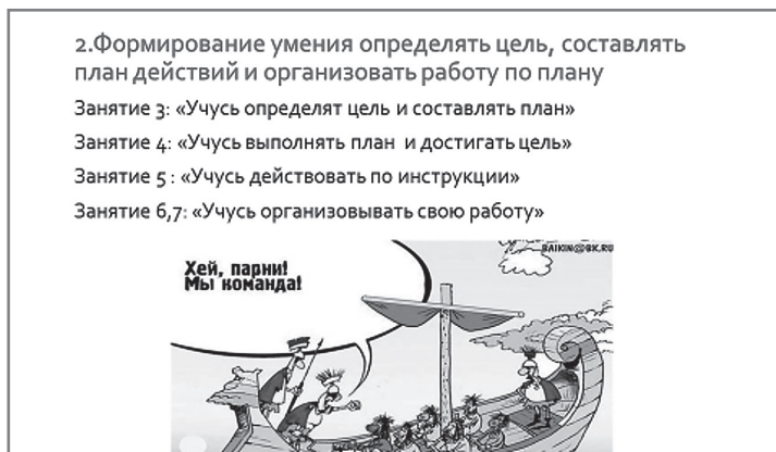
Рис. 6. План занятий

План занятий представлен на рис. 6. На этих уроках рассмотрены интересные и разнообразные упражнения. Вни-