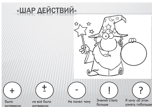
Рис. 5. Технология «Шар действий»

В конце урока дети оценивают свою работу, используя технологию «Шар действий» (рис. 5). Вместе с педагогом они делают вывод: чтобы овладеть профессиями, нужны: — способности — их мы развиваем; — знания — ими мы овладеем в школе;