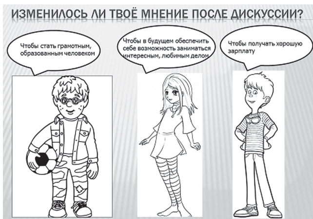
Рис. 2. Мнения после дискуссии

ников о том, как проходило обучение в старину на Руси. Свою работу на уроке они оценивают по технологии «Лестница достижений» (рис. 3). Мы даем детям установку: «Начни движение по ступенькам вверх! У тебя все получится!», обращаем внимание на то, что надо делать, чтобы оканзаться на верхней ступеньке.